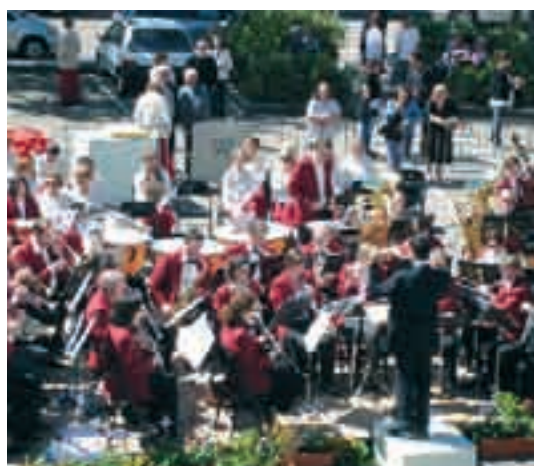
La société «Not'en bulles» et la chorale «La Mélodie des Sources» ont assuré l'accompagnement musical : hymnes, concerts et chants