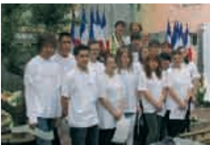
Lors de la cérémonie du 8 mai

- Participation émouvante et riche de symboles à la cérémonie commémorative du 8 mai 1945 aux côtés d'Anciens Combattants. Cette année de recherches, d'études, de rencontres, d'émotions et de réflexions a vu son point d'orgue lors de la Semaine de la Mémoire. Celle-ci s'est tenue du 8 au 13 juin à la salle Régina où une exposition a été présentée, avec des créations et productions variées (littéraires, musicales et plastiques) des élèves, acteurs du projet ■