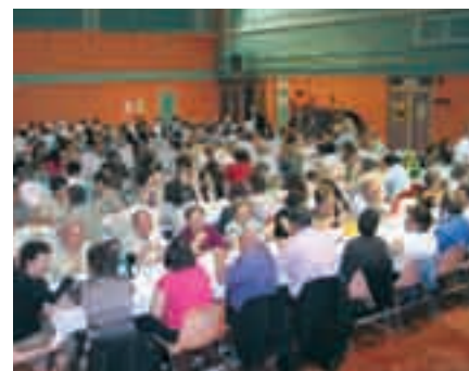
Le soir, toujours à l'hippodrome, 350 convives au repas organisé par l'Amitié Franco Portugaise