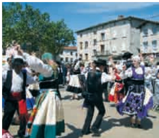
Folklore avec «Allegria do Imigrante»