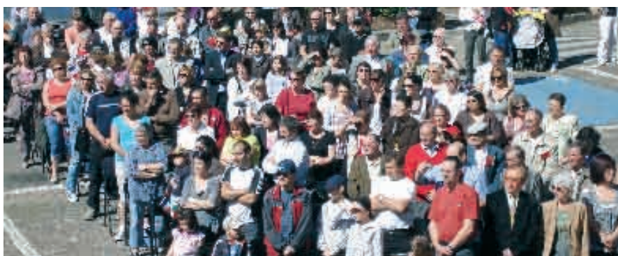
Beaucoup de monde, place de la Devise