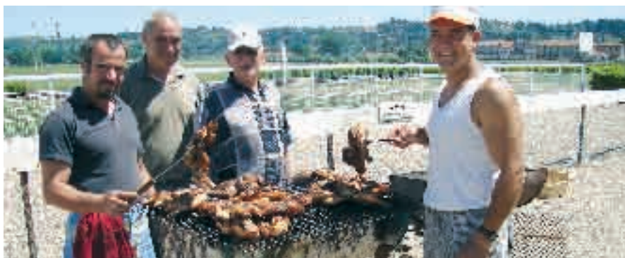
A l'hippodrome, grillades avec l'amitié Franco-Portugaise