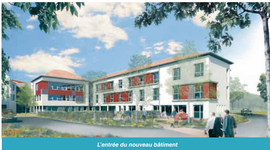
L'entrée du nouveau bâtiment

Il ne s'agit pas d'un projet d'extension de la capacité de l'établissement qui est maintenue à 256 lits. Toutefois, le projet laisse apparaître une « réserve foncière » que l'hôpital pourra aménager pour développer des réponses nouvelles aux besoins des populations locales.