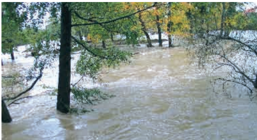
Une crue classée comme centennale