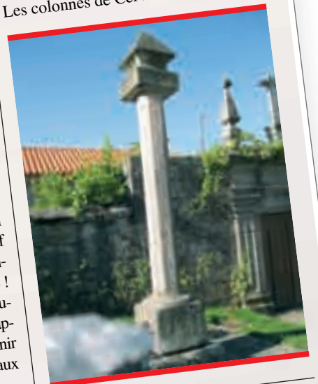
Ci-dessous : Les colonnes de Cerva.

Les équipements centraux sont nombreux et de qualité. Ecoles maternelle et primaire, collège seront prochainement regroupés sur un même site. La crèche jouxte le centre pour personnes âgées. Les enfants rejoignent les anciens lors des repas pris dans une salle communale. La municipalité de Ribeira de Pena est très attachée à cette rencontre des générations.