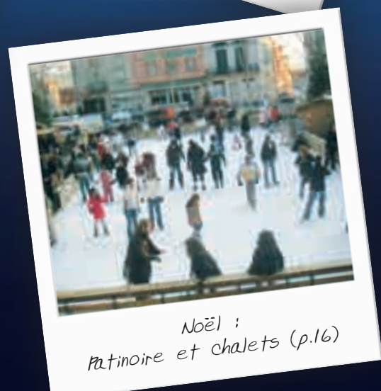
Noël : Patinoire et chalets (p.16)