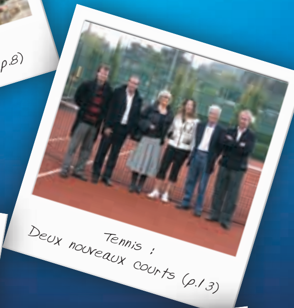
Tennis : Deux nouveaux courts (p.13)