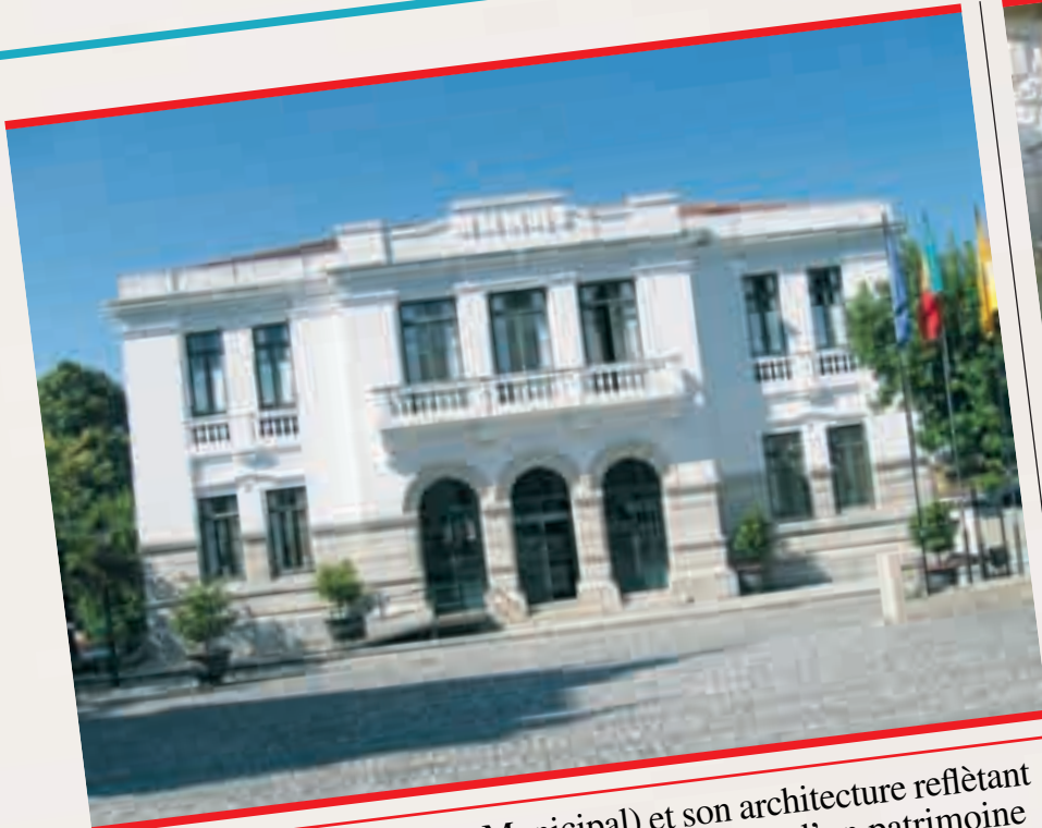
L'Hôtel de Ville (Câmara Municipal) et son architecture reflétant la forte présence d'un passé, d'une histoire et d'un patrimoine

Ville de Saint-Galmier / Concelho de Ribeira de Pena