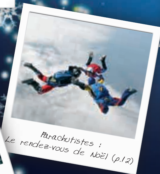
Parachutistes : Le rendez-vous de Noël (p.12)