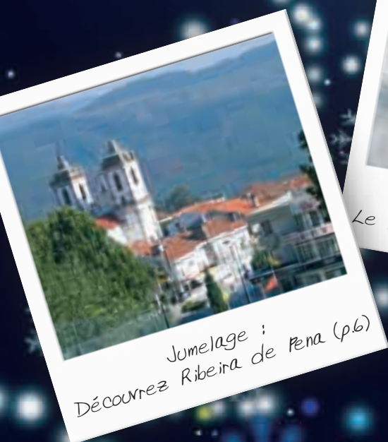
Jumelage : Découvrez Ribeira de Pena (p.6)