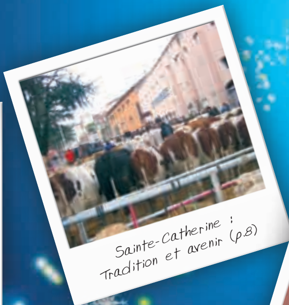
Sainte-Catherine : Tradition et avenir (p.8)