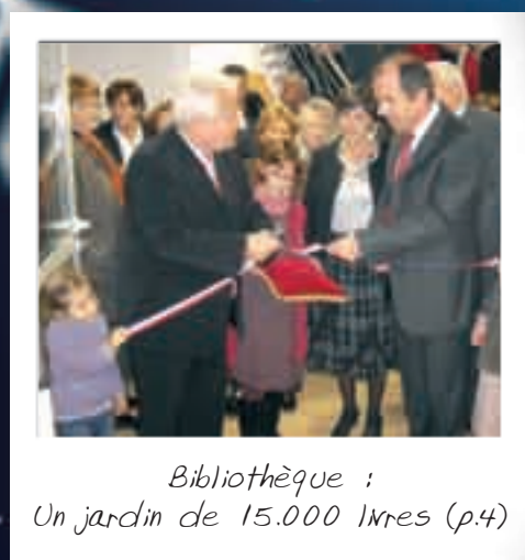
Bibliothèque : Un jardin de 15.000 livres (p.4)