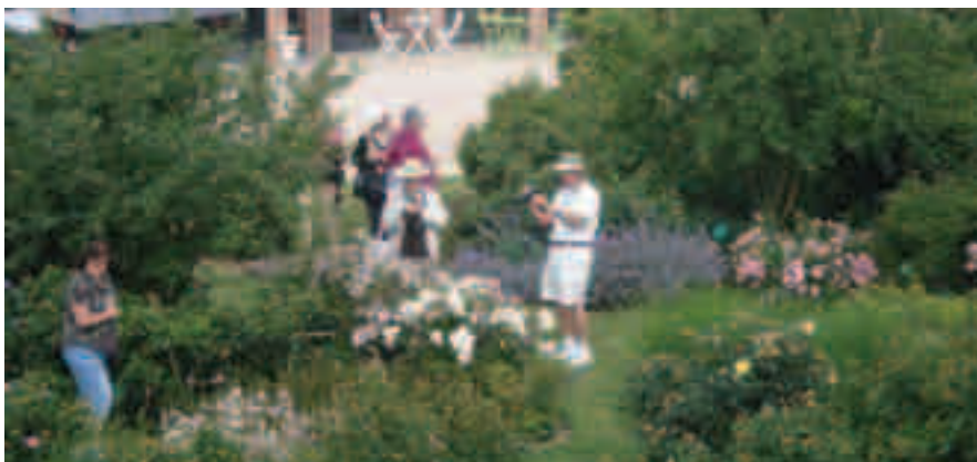
Les Américains ont découvert les collections exceptionnelles de la Roseraie

Venue à cette inauguration, une délégation américaine en a profité pour visiter la Roseraie qu'ils ont trouvée «une des plus belles du monde». Botanistes et pépiniéristes, ces mêmes Américains reviendront en juin 2015 pour assister au congrès mondial des roses anciennes qui se tiendra à Lyon et dont une journée se déroulera à Saint-Galmier ■