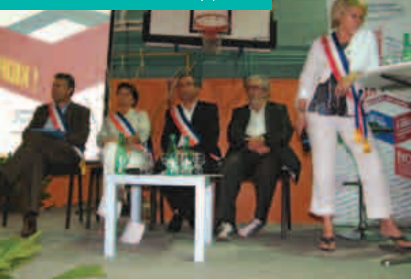
Une forte mobilisation des élus et de la population